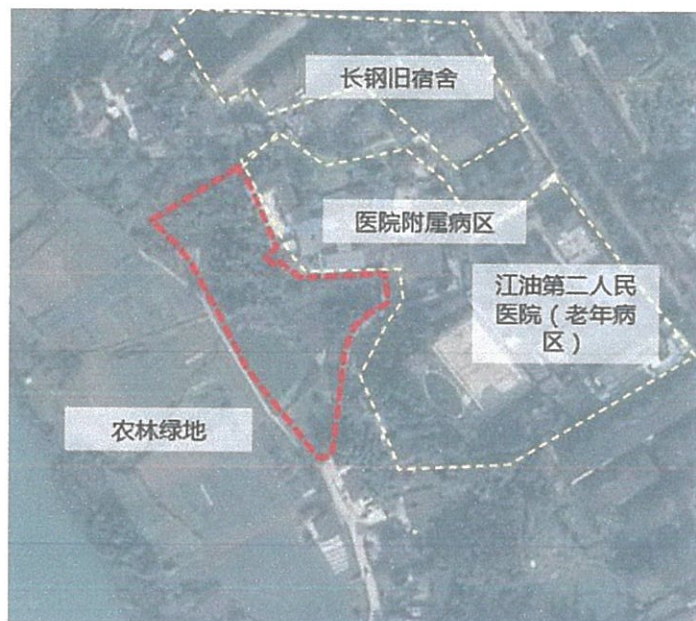
拟选址用地区位图